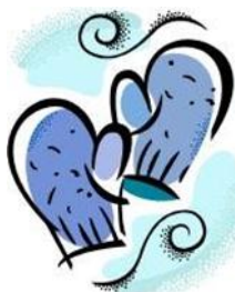
Vettlingar - rękawiczki