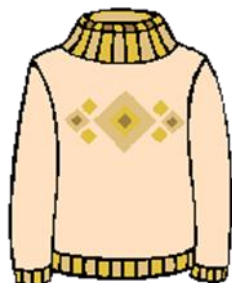
Peysa - sweter