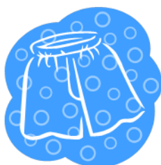
Stuttbuxur - krótkie spodenki