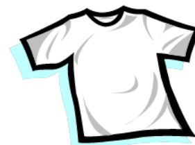
Bolur - koszulka