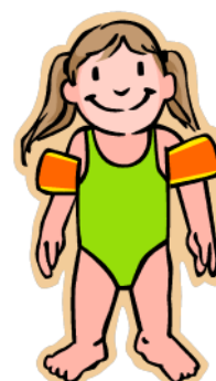
Sundföt - Strój kąpielowy