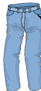
Buxur - spodnie