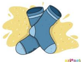
Sokkar - skarpety