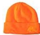
Húfa - czapka