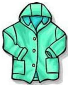
Úlpa - kurtka